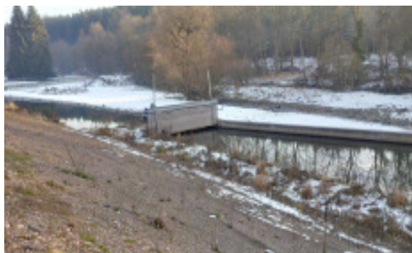
Zustand vor der Umsetzung